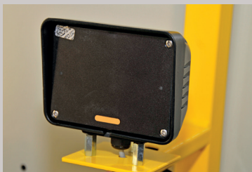
Kvalitetsradar m/60 m rekkevidde