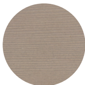
Furu, Country Brown

Furu er en lys, myk, hvit eller blekgul tresort. Den krymper eller sveller ikke, og dette er perfekte egenskaper for utebruk. Leveres med lameller av furu med maksimalt 13 % fuktighet, får som standard en overflatebehandling i tre valgfrie fargetoner. Basislaget består av et hurtigtørkende impregneringsmiddel, blant annet med soppdrepende komponenter som beskytter treet mot råte og mot å bli blått. Andre sjikt basert på naturlige planteoljer og voks påføres slik at treverket blir vær-, UV-, ripe- og kjemikaliebestandig. De naturlige oljene trenger dypt ned i treverket, holder det friskt og elastisk og hindrer uttørring. Treverket kan puste, og fuktigheten reguleres. Siste overflatebehandling foretas med tre valgfrie fargetoner: Country Brown, Park White og Urban Grey.