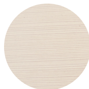
Furu, Park White