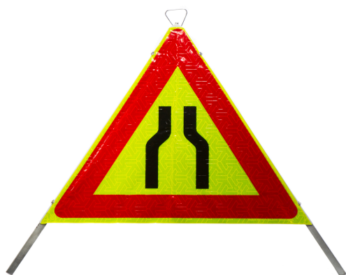
Foldeskilt MS, komplett, skilt 106.1 (41612000110)

Foldeskiltene leveres med klasse 3 fluorescerende refleks (garantitid på 12 år i hht HB R310), etui for oppbevaring og lodd for å holde skiltet på plass selv når trailerne suser forbi. Etter endt bruk klappes skiltet sammen og legges i etuiet som følger med. Dette gjør at skiltene tar liten plass ved oppbevaring og transport.