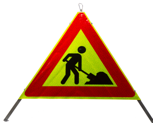
Foldeskilt MS, komplett, skilt 110 (41612000156)