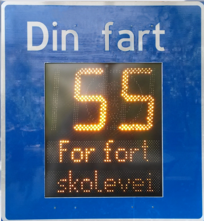
Mål: 100 x 108 x 18,2 cm (B x H x D)